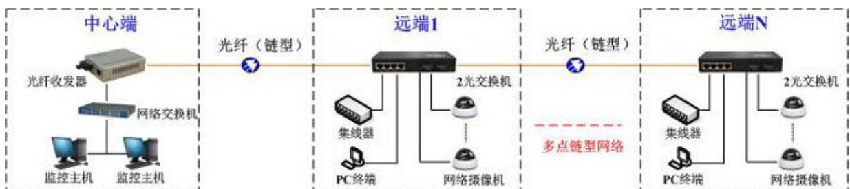
方案一：光纤多点组链型网络