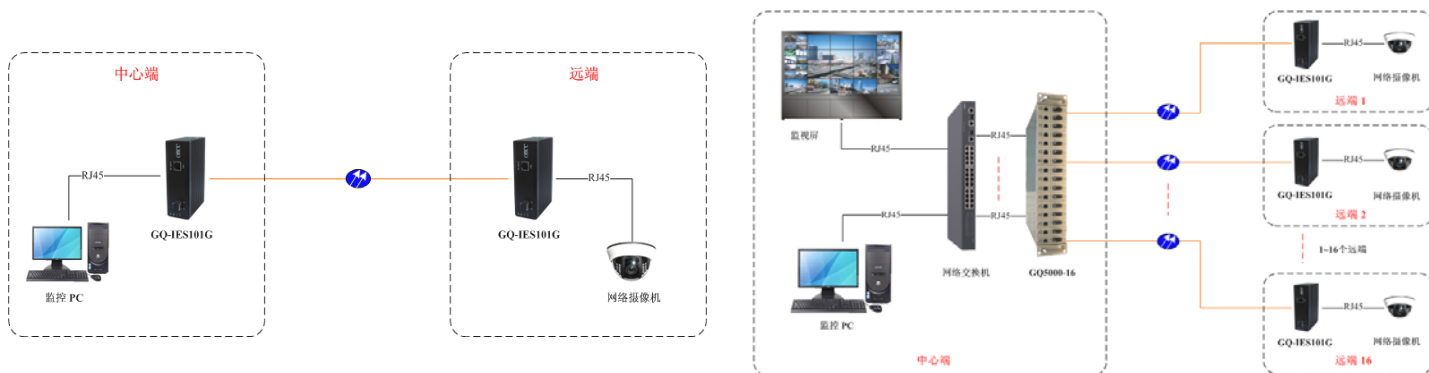
方案一: 点对点应用